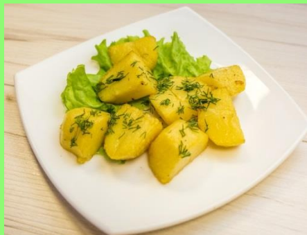
Картофель отварной с маслом и зеленью вес порции – 200 грамм