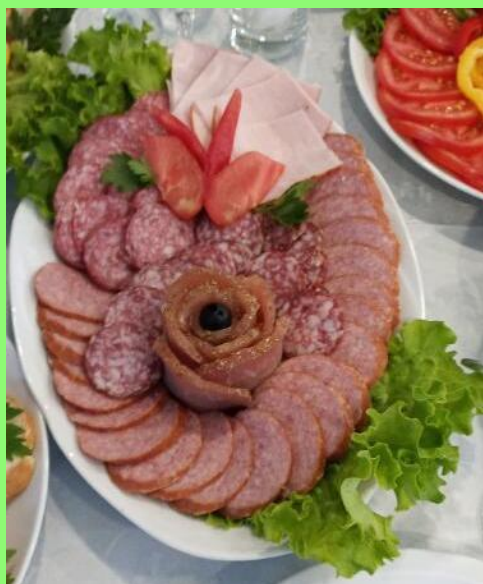
Нарезка мясная вес порции – 150 грамм